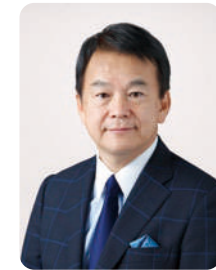
公益社団法人 さいたま観光国際協会 名誉会長

ご参加される方々と、ご来場いただく皆様には、7月と9月の2回にわたる「浦和まつり」を大いに楽しんでいただき、さいたま市を盛り上げていただければ幸いです。