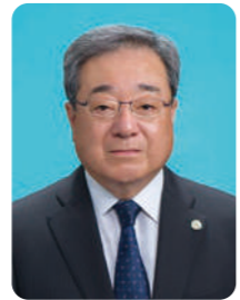
浦和まつり中山道会場 実行委員会 委員長

今年は、7月と9月の2度に渡る活気あふれる「浦和まつり中山道会場」にお越しいただき、存分に楽しんでいただければ幸いです。